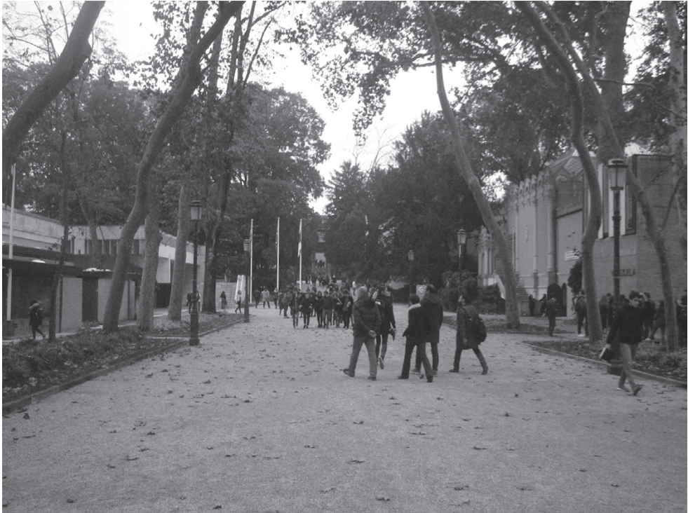
Национальные павильоны Венецианской биеннале в садах Джардини. Справа – павильон России, построенный по проекту Алексея Щусева в 1914 г.

Наверное, я никого не удивлю, если скажу, что любая международная выставка, а в особенности архитектурная, демонстрирует нам, зрителям, некую материализованную проекцию картины мира, составленную из