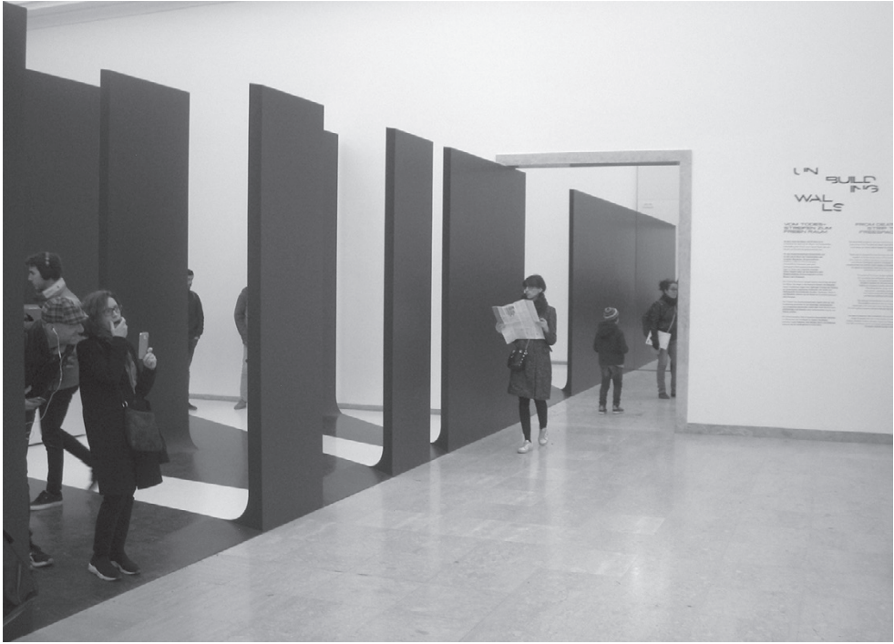
Экспозиция «Демонтируя стены» в павильоне Германии: общий вид

Одна из видеоинсталляций павильона под общим названием «Стена мнений» репрезентировала отношение жителей ряда стран, где сегодня продолжают существовать различные стены, ограждения, заборы и другие рукотворные барьеры, превращающие свободные пространства в зоны отчуждения. Это – линии ограждений, названные «Стенами мира», разделяющие католическое и протестантское население городов Северной Ирландии, комплексы демаркационных сооружений на Корейском полуострове и острове Кипр, металлические ограждения вокруг испанского полуанклава Сеута на северном побережье Африки, трамповская стена на границе с Мексикой и, конечно, разделительный барьер между Израилем и Западным берегом реки Иордан. Инсталляция состояла из рядов плазменных экранов, на которых демонстрировались интервью, записанные немецкими журналистами у жителей этих стран. Информанты, проживающие по разные стороны демаркационных линий и принадлежащие к разным национальностям и социальным группам, открыто рассказывали о том, как им живется сегодня на разделенных территориях. Большинство осуждали строительство стен и мечтали о тех временах, когда никакие демаркационные линии будут не нужны. В этом хоре мнений несколько выделялись голоса жителей Израиля и Палестинской автономии: если палестинцы однозначно говорили, что «Стена» – это несомнен-