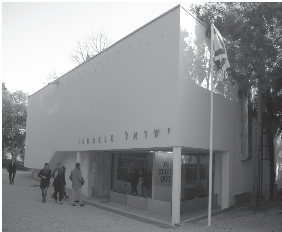
Павильон Израиля на Венецианской биеннале в садах Джардини, построенный по проекту Зеэва Рехтера в 1952 г.

из самых эффектных на биеннале» и даже «героическим» [Ревзин 2008]. Действительно, что-то героическое в этой постройке есть – белый лаконичный объем с четко акцентированным входом в нижней части фасада справа контрастно противостоит своей монотонной простотой всевозможным архитектурным затеям – от эклектики до постмодернизма, – отразившись в облике других национальных павильонов биеннале. Недаром этот павильон был построен в 1952 г. по проекту знаменитого израильского архитектора Зеэва Рехтера (1899–1960) – одного из пионеров «интернационального стиля» школы Баухауз еще в подмандатной Палестине.