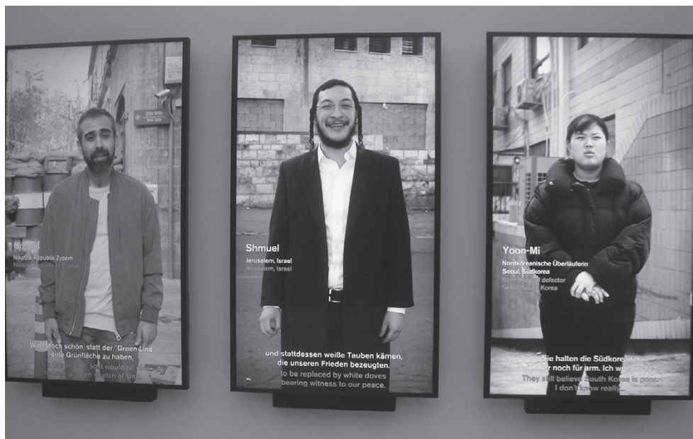
Экспозиция «Демонтируя стены» в павильоне Германии: фрагмент видеоинсталляции «Стена мнений»

ное зло и ее следует незамедлительно снести, то израильтяне были достаточно осторожны в своих высказываниях, утверждая, что, пожалуй, в возведении всевозможных барьеров нет ничего хорошего, однако под защитой «Стены» стало жить как-то спокойнее, но в будущем, когда палестино-израильский конфликт будет урегулирован, она, конечно, будет разрушена.