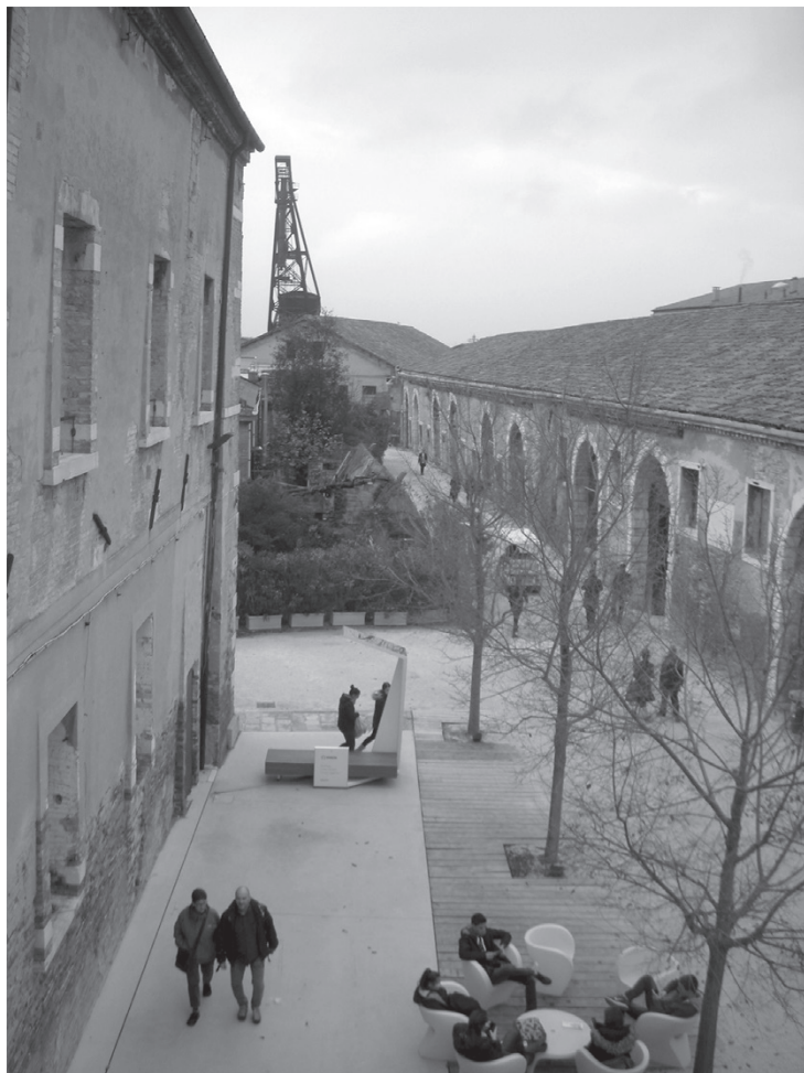
Павильоны Венецианской биеннале на территории Арсенала

представлений о своих странах авторов экспонирующихся проектов. Однако то, какова эта картина – идеализированная или прагматическая, умиротворяющая или шокирующая, ностальгическая или футуристическая, – зависит в первую очередь от усилий главных выставочных кураторов. Насколько убедительно им удастся сформулировать основную тему выставки и увлечь ею всех участников, представляющих разные страны, культуры, политические режимы, и при этом не прибегнуть к авторитарным методам руководства, – настолько успешной будет выставка в целом.