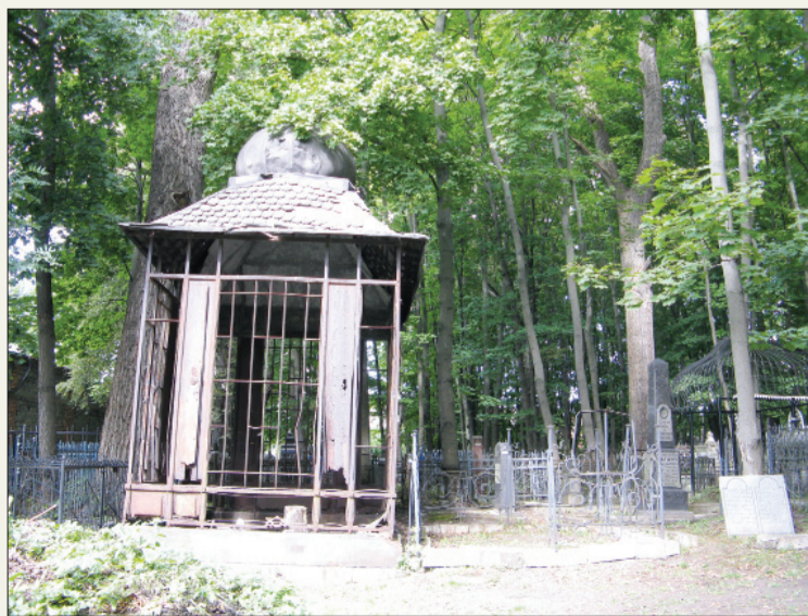
Старинное еврейское кладбище в Туле. Современный вид.