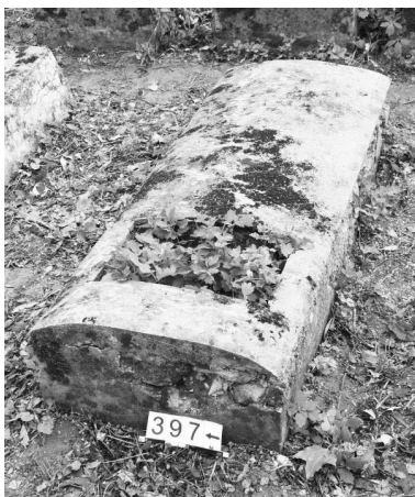
Рис. 4. У торца или боковой стороны горизонтального надгробия (саркофага)