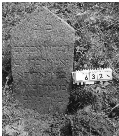
Рис. 3. Сбоку от вертикальной стелы, осевшей в грунт