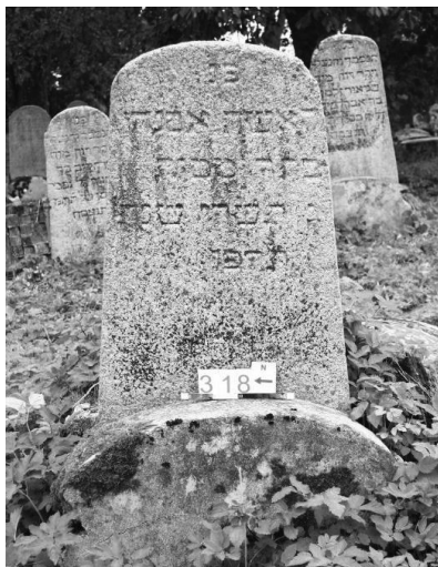
Рис. 1. У основания лицевой стороны вертикальной стелы