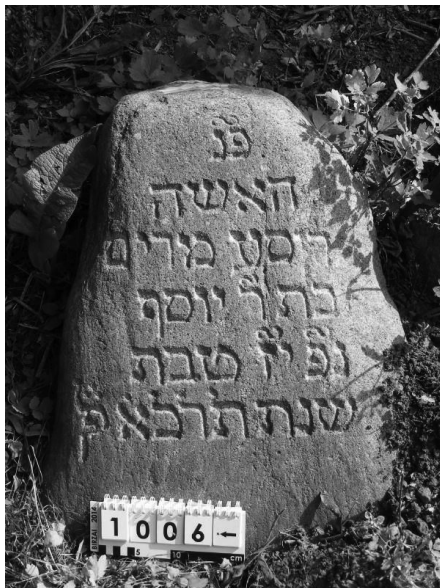
Стела №1006 (лицевая сторона обращена к западу)