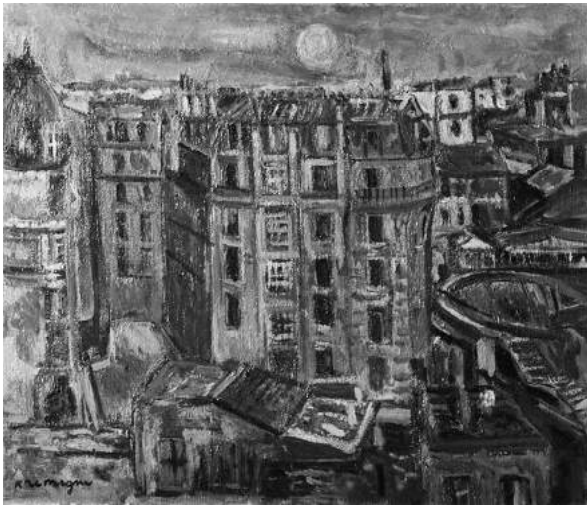
Пинхус Кремень. «Крыши Парижа» (1918)

Желудок является родиной нескольких известных представителей творческой интеллигенции. Бэн-Авигдор (Аврохам Лейб Шалкович) родился в Желудке в 1867 г. Получил традиционное еврейское образование, с 1891 г. жил в Варшаве. Бэн-Авигдор — писатель, издатель, один из первых популяризаторов литературы на иврите. В Варшаве издавал серию «Сифрэй агора», книги которой были небольшими по формату, хорошо оформленными и недорогими. Эта серия выражала взгляды «новой волны», которая старалась возродить литературу на иврите в русле реалистического направления, распространенного в это время в Европе. В 1893 г. Бэн-