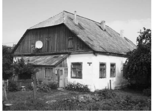
Еврейский дом на ул. Октябрьская.

По рассказам местных жителей, здесь располагалась еврейская школа (молельня)