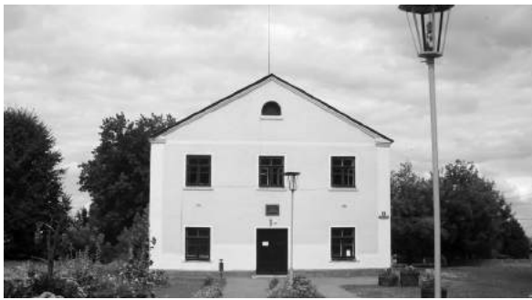
Синагога Желудка (сейчас Дом культуры). Современный вид. Фасад