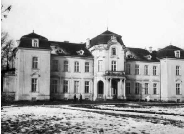
Дворец князей Святополк-Четвертинских