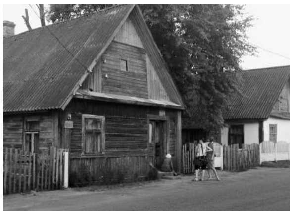
ул. Краснопартизанская, д. 29. По рассказам местных жителей, здесь располагалась еврейская пекарня