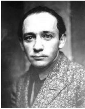
Художник Пинхус Кремень