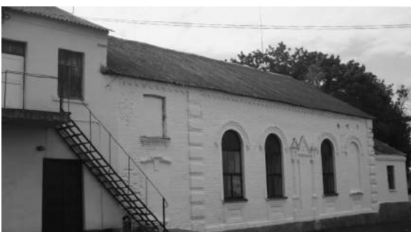
Синагога Желудка. Боковой фасад