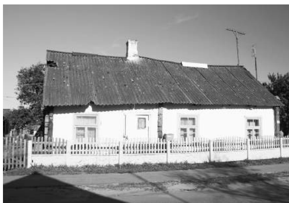
ул. Краснопартизанская, д. 20