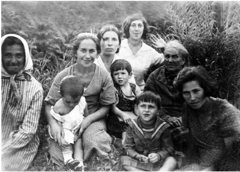
В поле у Лепеля (запечатлена женская часть семьи в одно из предвоенных лет. Вероятно, 1936 г.)