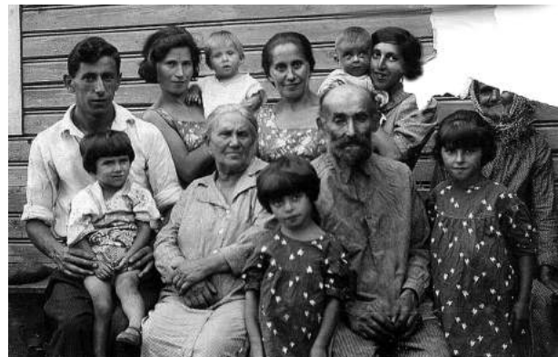
Лето, кажется, 1940 г.