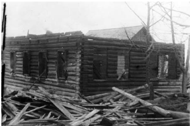
Одна из чашникских синагог после пожара 1923 г.