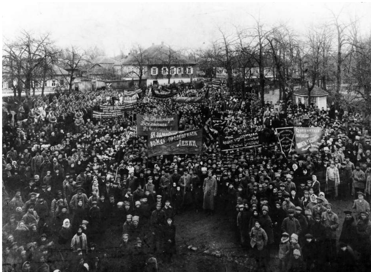
Митинг в г. Лепеле, 1917 г.

антихедерной кампании: в этот день для евреев города был прочитан доклад «О функциях еврейских школ и вредности хедеров» 68 .